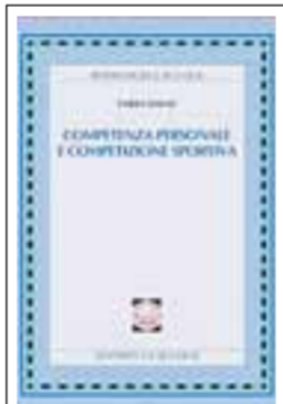
FABIO TOGNI Competenza personale...