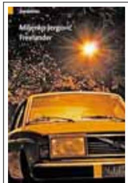
MILJENKO JERGOVIC Freelander

Cosa poteva venire, ora, dallo zio Tadjia? Non sarà uno scherzo? Nella mente di Karlo si affollano i ricordi. Le periodizzazioni del passato, suo e della famiglia, sono scandite, regolate sulle molte guerre che hanno flagellato la regione balcanica. Questo è successo ai tempi della guerra tale, quello ai tempi della guerra talar... Dal primo conflitto mondiale, quando, nel terribile inverno del '15, il nonno era a combattere in Galizia, e «i bambini morivano in massa nei loro letti per via del freddo». Sino a «quest'ultima guerra», quando al telegiornale «scorrevano le immagini di Sarajevo», le «vie insanguinate» e la madre di Karlo diceva: «Eh, il vecchio diavolo ha avuto quello che si meritava. Dio c'è!». Karlo decide di partire, con la sua vecchia Volvo 245, alla volta di Sarajevo, che non vede più da quando era bambino. Ma porta con sé una pistola, nel cruscotto della macchina. Un viaggio ironico, paradossale, ipercritico, ma anche pieno di pietas e amore (frustrato) per il proprio paese.