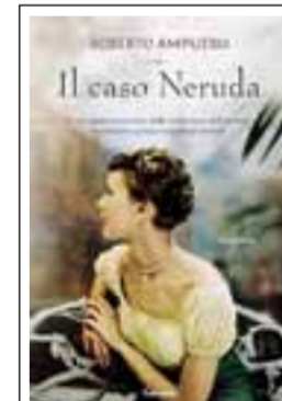
ROBERTO AMPUERO Il caso Neruda